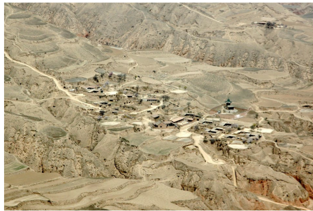
援建前，坡陡沟多行路难

群山之中的东乡县高山乡布楞沟村过去没有路，确切地说是没有车能走的路。因为没有一条像样的路，布楞沟村成为东乡县最闭塞最贫困的村庄之一。得知村民们的困难后，中国石化积极开展帮扶。2013年3月，中国石化派专家组深入东乡县进行实地考察后，决定投资2,500万元为布楞沟修建一条出村主干道——布楞沟村通村硬化路。这也是中国石化在东乡县实施的第一个帮扶项目。5月，仅仅用了62天，从沟底到山顶的宽5米，长达20公里，加设防护栏3,000多个的水泥硬化路就建好了，蜿蜒平整地通向布楞沟村的家家户户。布楞沟村通村硬化路的修建不仅保障村民出行安全，更有效带动了布楞沟村经济发展，极大地提升了当地老百姓的获得感、幸福感，也坚定了中国石化定点帮扶的信心和方向。