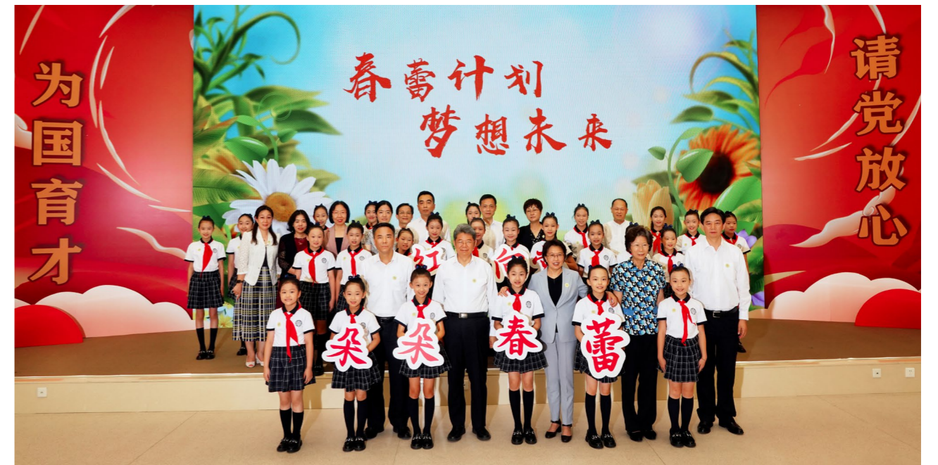
中国石化在东乡县石化中学建设完成全国首个“春蕾加油站”女童成长友好空间，用爱为春蕾女孩插上腾飞的翅膀