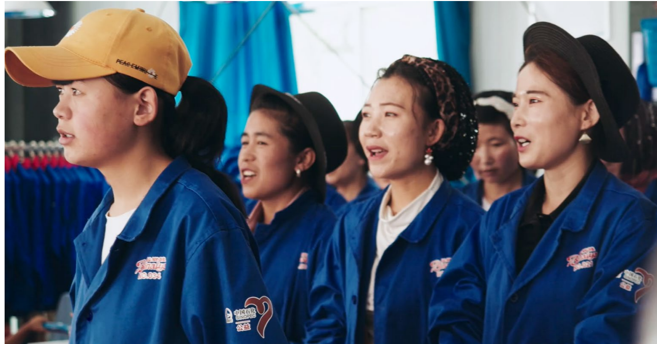
当地女工在比耐雅劳保制品工厂放声欢歌