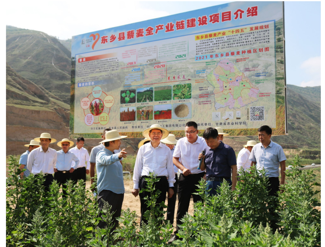
中国石化董事长、党组书记马永生（前排左二）一行到东乡县调研，察看藜麦产业发展情况，走访慰问脱贫群众

脱贫攻坚战取得全面胜利后，中国石化借鉴脱贫攻坚形成的领导体制和工作机制，切实加强对巩固脱贫成果和乡村振兴工作的组织领导，建立责任和管理体系。发挥好工作领导小组成员单位的作用，综合管理部负责协调党组领导赴帮扶地区调研；党群工作部统筹管理捐赠、帮扶工作；集团（股份）财务部负责落实帮扶资金；人力资源部负责挂职干部选派、考核，协调做好就业帮扶、技能培训等工作；纪检监察组牵头负责对帮扶领域日常管理中发现的突出问题开展专项治理；党组宣传部负责帮扶宣传、典型经验总结推广；各事业部按照内控要求，负责审批管理各直属企业帮扶项目，进一步凝聚工作合力。