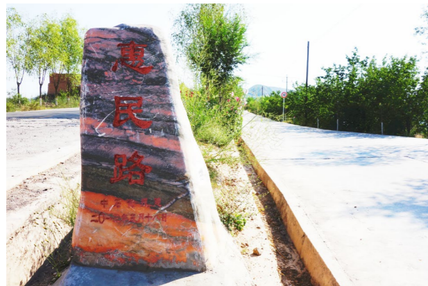
援建后，路通人通民心通