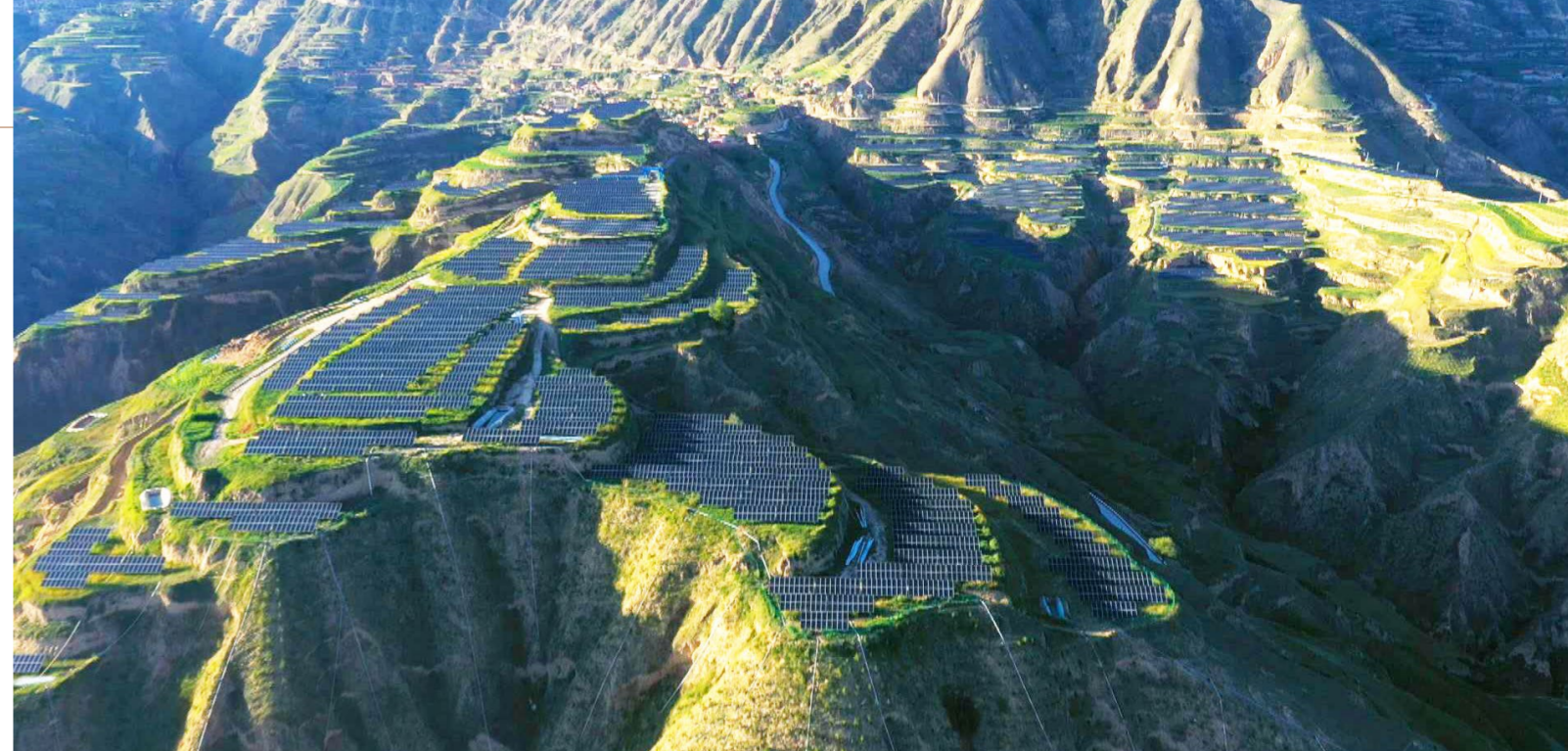
中国石化在布楞沟流域援建的光伏发电项目