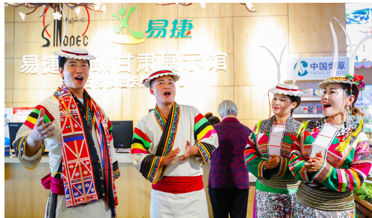
中国石化建设“易捷·臻品甘肃”体验馆，设立东乡县特色产品展区，做大产品销量，进一步增强品牌影响力

此外，在兰州核心地区设立“易捷·臻品甘肃”体验馆，实现集帮扶产品销售、“臻品甘肃”APP 体验及易捷线上线下联动。在兰州地铁 1 号线 18 座易捷便利店，打造不同县区农牧品为主的特色门店，陈列、展示、销售甘肃特色农牧品，推动特色农牧品进易捷便利店，打造农产品销售线下阵地。在南京建立长三角首座甘肃馆，将其打造为甘肃农牧品展示平台、甘肃地域旅游文化宣传窗口。将东乡县特色农产品包括东乡贡羊、油馍馍、唐汪八宝、八宝茶、刺绣、擀毡、土豆粉条等 7 家当地企业产品引入易捷便利店、“臻品甘肃”等销售渠道，帮助农特产品塑造品牌，推广宣传，带动群众稳定增收。