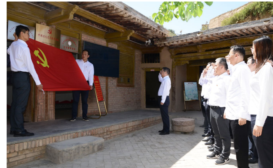
党员干部走进布楞沟村中国石化党员教育基地参观学习

2021年4月,中国石化党员教育基地在布楞沟村史馆正式揭牌,9月被确定为中国石化“十大红色教育基地”,至今已接待党员、基层党支部书记、中青年干部和劳模先进等前来开展党性教育,学习脱贫攻坚精神,感受布楞沟流域天翻地覆的变化。