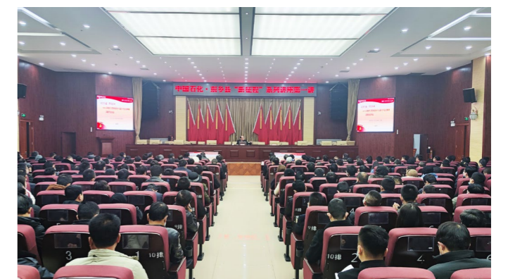
2021年12月,举办中国石化·东乡县“新征程”系列讲座第一讲。中国石化邀请党史学习教育中央宣讲团成员为县乡镇全体干部和乡属各单位主要负责人等作了党的十九届六中全会精神专题辅导

为推动党的创新理论进乡村、到地头、进校园,中国石化进一步探索完善企地党校间深度合作机制,推进中国石化·东乡县“新征程大讲堂”活动,深化乡村振兴帮扶干部培训研究,为高质量帮扶东乡县培养高素质、强能力、善作为的乡村振兴管理人才。与东乡县签订培训合作协议,帮助东乡县邀请专家学者为全县党员干部授课。选派石化党校专家到临夏州委党校,围绕如何提高党校教学和干部培训质量进行专题交流,有效提升党校系统教学科研水平。