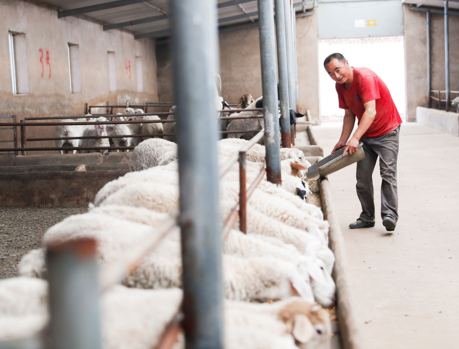
中国石化帮助当地发展东乡贡羊养殖产业，因地制宜帮助百姓致富奔小康