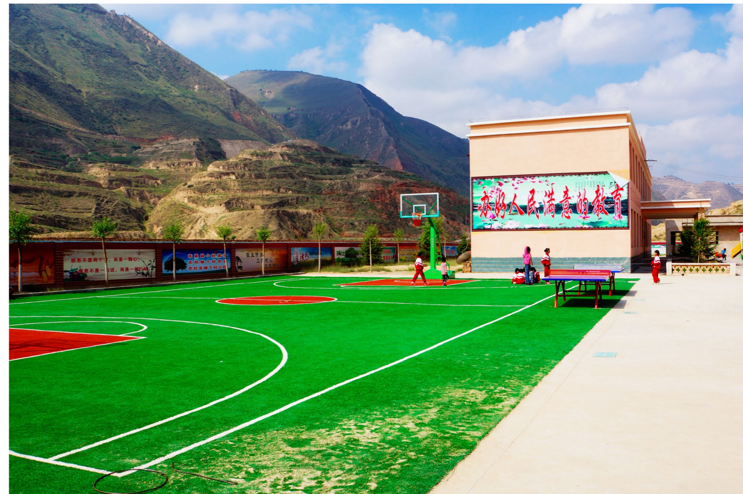
新建的布楞沟小学成为村里一道亮丽的风景，学校变美了，孩子都来上学了……