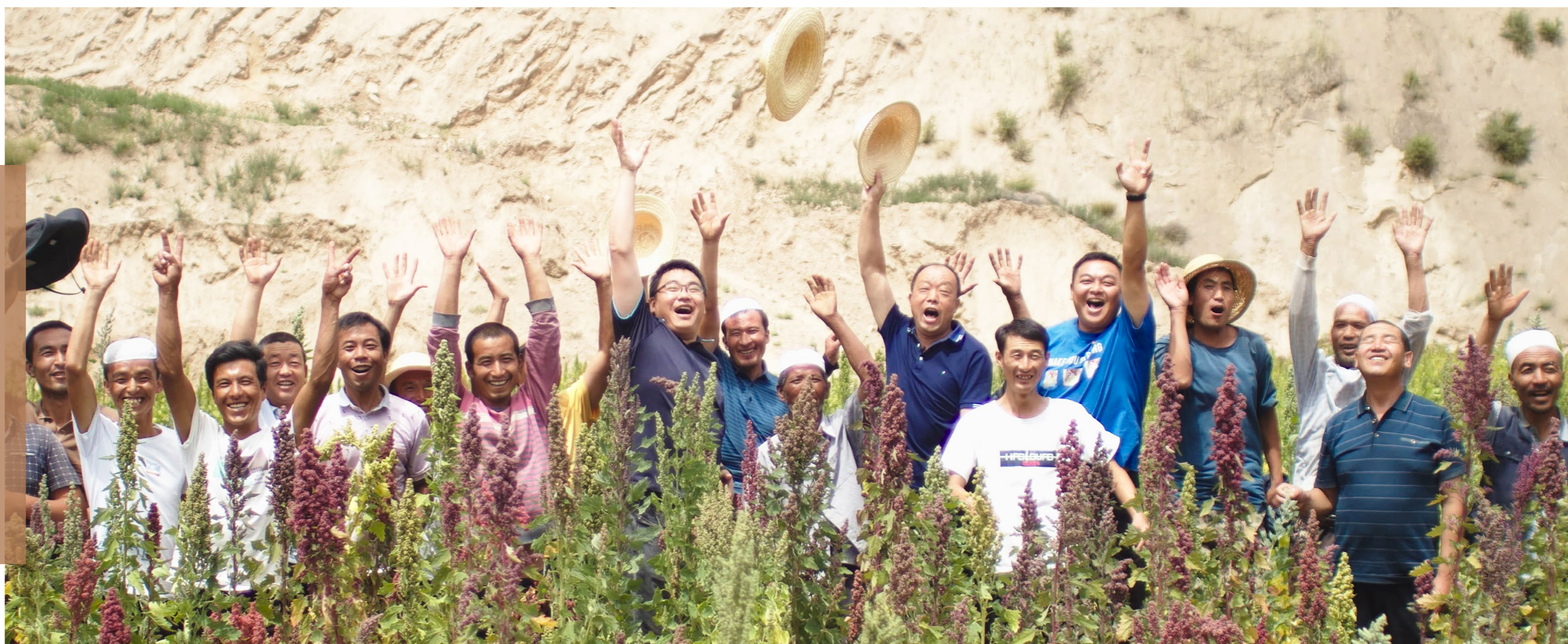
中国石化派驻东乡县挂职干部

2013年以来，中国石化先后向甘肃省东乡县派驻挂职干部5批8人，向甘肃省临夏州派驻挂职干部3批3人，将初心和使命镌刻在脱贫攻坚与乡村振兴的主战场上。当前，还有3名帮扶干部仍奋战在帮扶一线。他们用真心和真情开展帮扶工作，引来幸福水、修通惠民路、建设新农村，为当地如期攻克深度贫困堡垒、迈向乡村振兴作出了重要贡献。