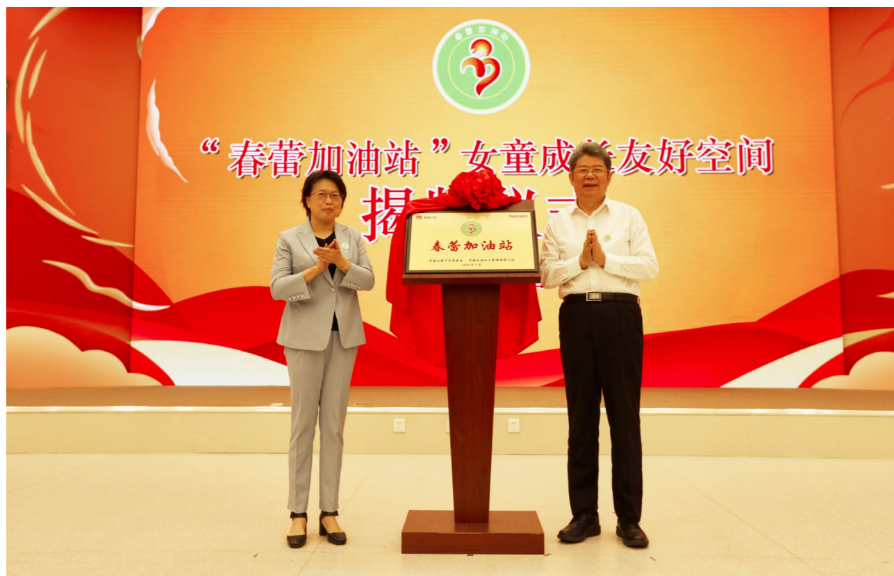
全国妇联党组书记、副主席、书记处第一书记黄晓薇（左），中国石化董事长、党组书记马永生（右），共同为“春蕾加油站”女童成长友好空间揭牌