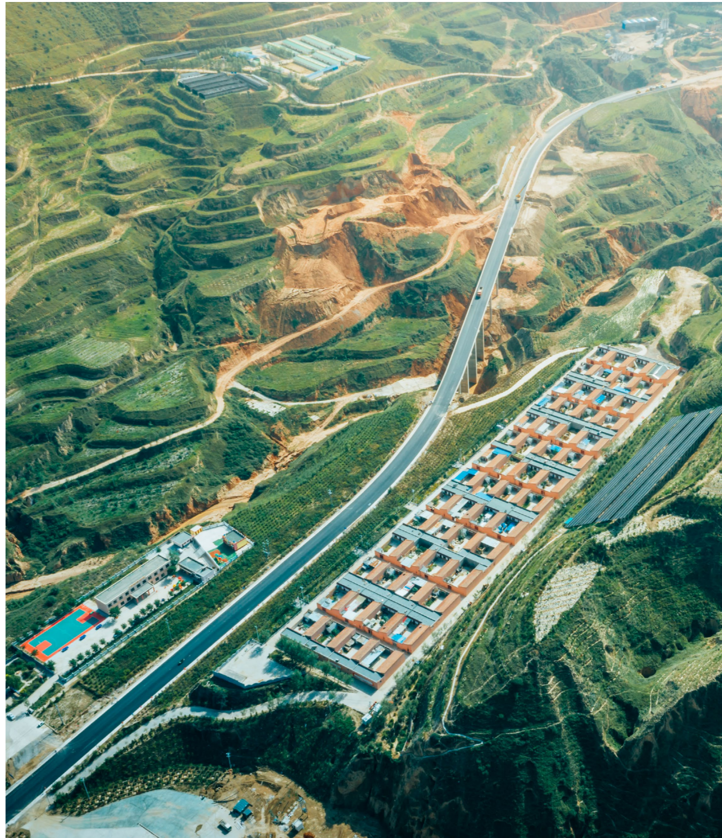
布楞沟村通村硬化路与折红二级公路连接