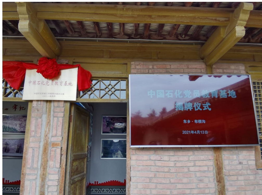
中国石化党员教育 基地在布楞沟村史 馆揭牌