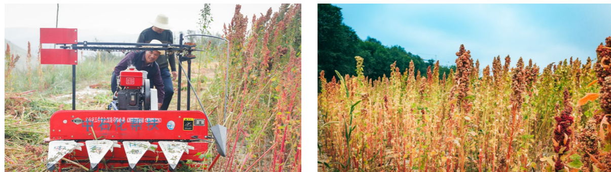
藜麦喜获丰收，农户充分感受到了种庄稼的快乐和对美好生活的向往

中国石化邀请科研机构及农科院专家普及种植技术，指导种植方法，造就一批藜麦种植的“田专家、土秀才”，推进提产增效。2021年，先后积极协调开办培训20班次，培训乡村基层干部2,639人次、藜麦种植户等专业技术人员5,363人次，培养致富带头人1,210人次，为东乡县藜麦产业振兴积累了技术人才。