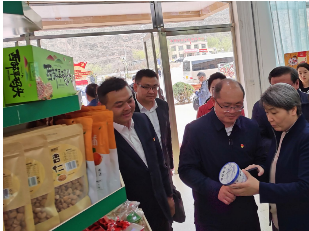
中国石化总经理、 党组副书记赵东 (前排右二)一行 赴东乡县调研

实施乡村振兴战略,帮扶机制是保障。中国石化和东乡县党委主要负责同志每年至少开展一次互访活动并召开党政联席会议,共商年度帮扶工作重大事项,研究部署和协调推进中央定点帮扶工作。成立专门对接中央定点帮扶工作机构,负责统筹协调和对接落实中央定点帮扶各项工作。工作机构建立精准对接和有效落实机制,加强相互之间的协作与衔接,确保协议有效落实。