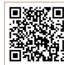
“码”上查看： “加油冬奥 圆梦冰雪——中国石化点亮希望行动”