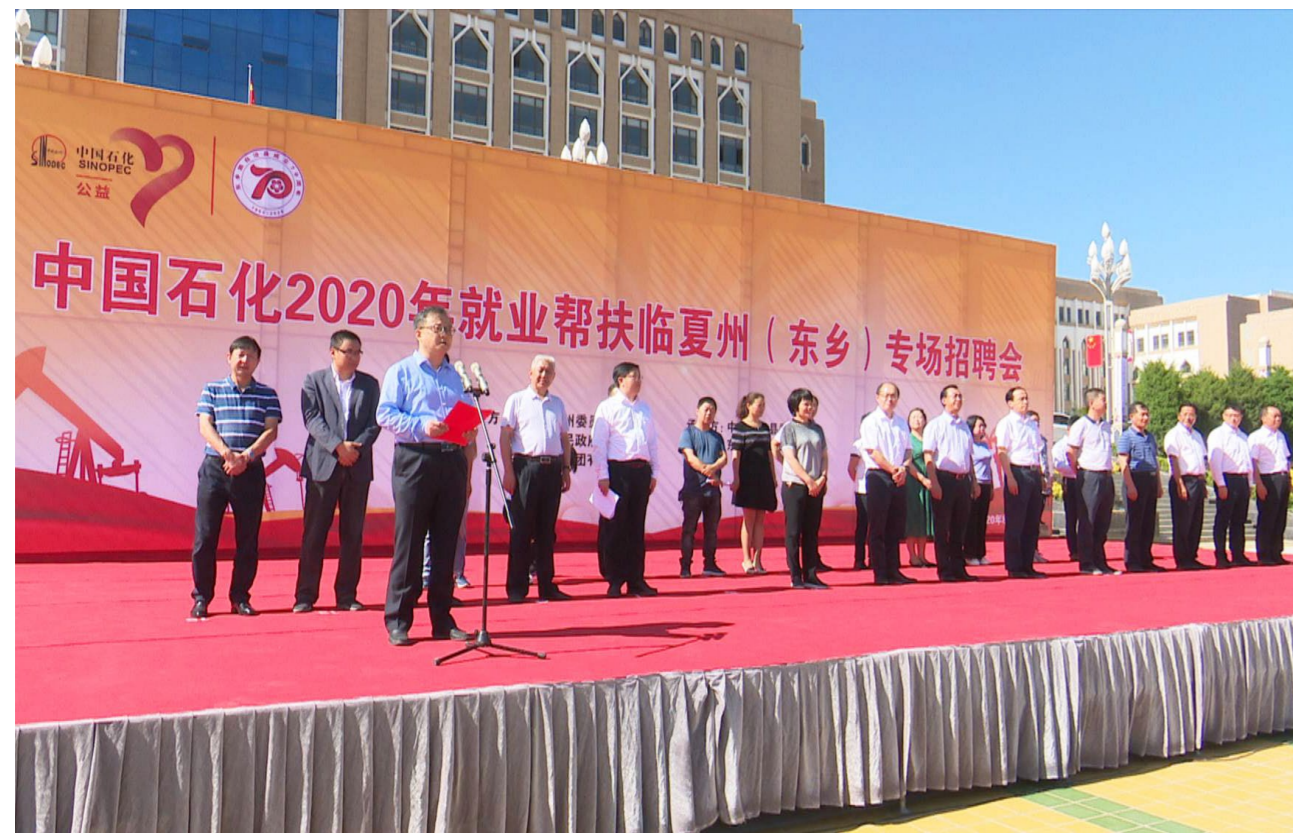
中国石化 2020 年就业帮扶临夏州（东乡）专场招聘会

中国石化多次举办“中国石化未稳定就业大中专毕业生东乡专场招聘会”，接收上百名东乡大中专毕业生到中国石化下属企业工作，助推“一人就业、全家脱贫”。支持东乡高中毕业生到兰州石化职业技术学院、兰州资源环境职业技术学院接受职业教育，培养学生掌握一技之长，提高就业竞争力。